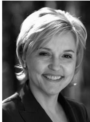
Dr. Beate Merk, MdL Bayerische Staatsministerin der Justiz und für Verbraucherschutz